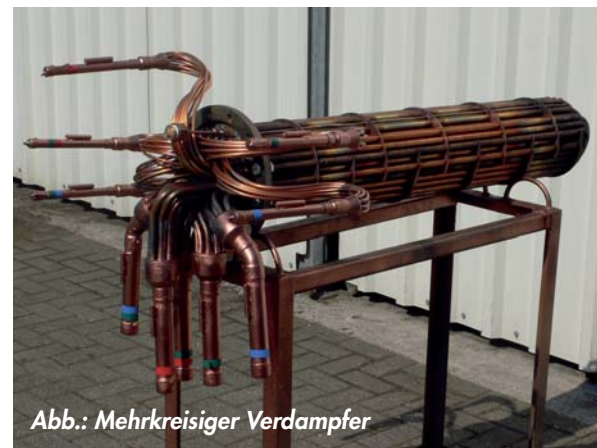
Abb.: Mehrkreisiger Verdampfer

Bei dem DK-Kaltwasserbereiter werden die KS-Verdampfer mit einer sehr aufwendigen Flüssigkeitsverteilung und saugseitiger Zusammenschaltung ausgerüstet. Außerdem wird mit Umlenkbögen an der gegenüberliegenden Seite eine exakte Führung des Kältemittels erreicht. Das Ergebnis ist eine nahezu 100% gleichmäßige Kältemittelverteilung auf die einzelnen Rohre, so dass auch von gleichen Temperaturen in allen Rohren auszugehen ist. Dies ist eine Voraussetzung für einen problemlosen Betrieb mit Verdampfungstemperaturen im Minusbereich und Wassertemperaturen nahe dem Gefrierpunkt gegeben.